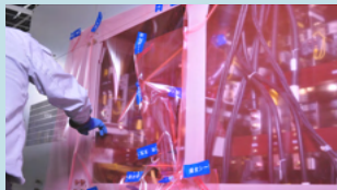
▲ 実際の現場では複数サイズのシートを組み合わせて養生を行います